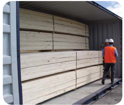
나이튼스 수출 목재