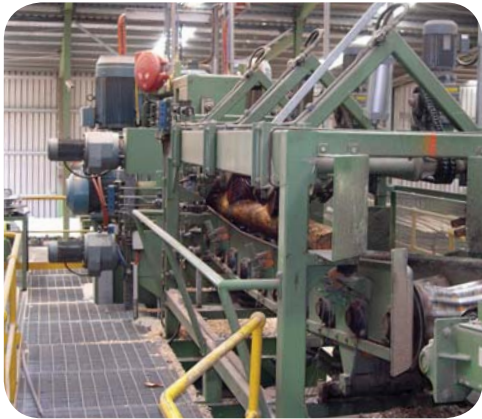
나이튼스 소규모 목재 공정