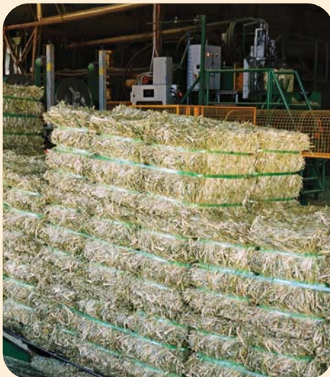
동부에 있는 공장에서 취급 하기 쉽도록 규격화된 포장.