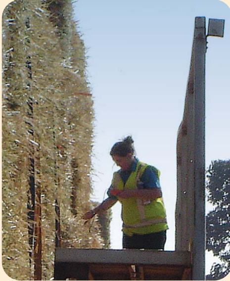
엄격한 수분과 품질 관리로 건초가 최적의 상태에서 가공됨.