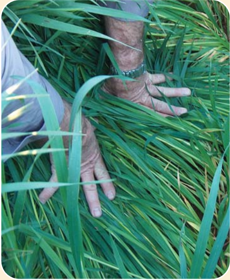
철저한 농장관리로 제품이 오염 되지 않게함.

Pentarch Farm에 입고되는 모든 건초는 가공하기 전에 직접적인 관찰과 실험을 통하여 균질성을 확인한 후 모든 등급이 정해집니다. 실험 분석은 매 선적분에 대하여 실시됩니다.