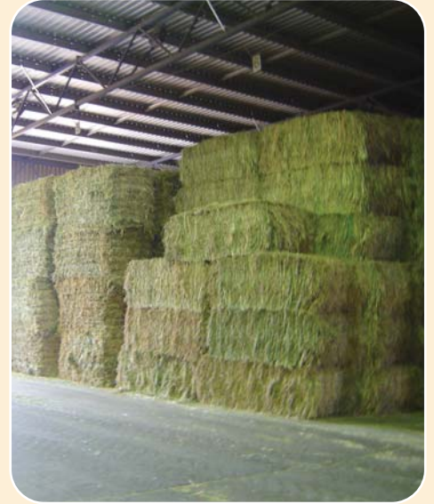
모든 건초는 농장 창고와 가공 시설이 있는 장소에 보관.