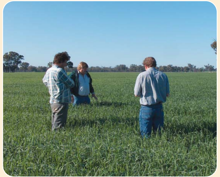
호주동부에 위치한 가공 시설에서 농작물 검사.