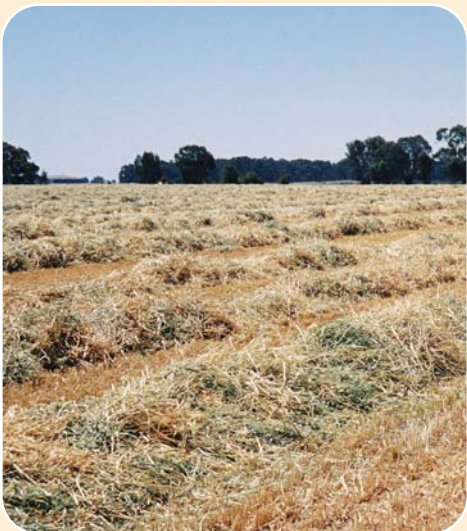
노지에서 경작된 연맥 건초를 베일링하기전 햇볕에 말려 건조.